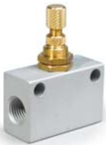
Características de caudal a 6 bar